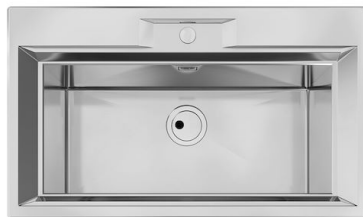
水槽 FL 2975 060